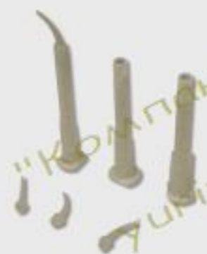
миксеры для клея