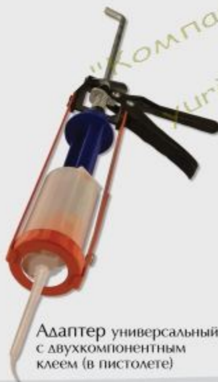
Адаптер универсальный с двухкомпонентным клеем (в пистолете)