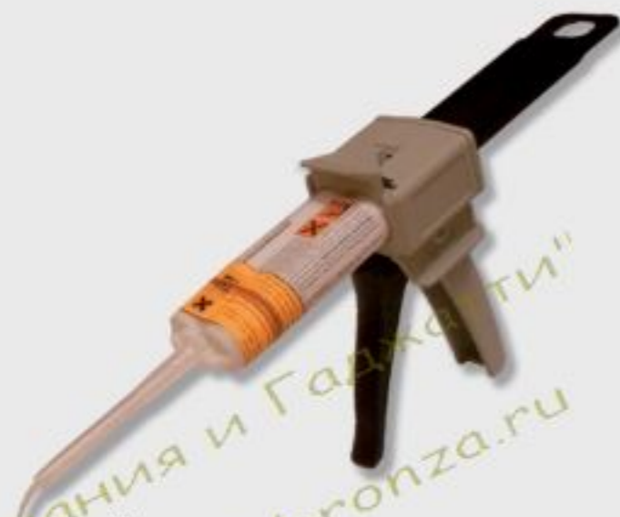
Пистолет с двухкомпонентным клеем