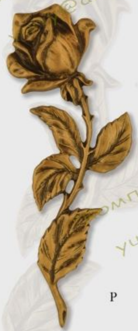
G191 h=23/32cm color Z/B