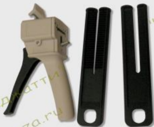
Пистолет универсальный (для двухкомпонентного клея)