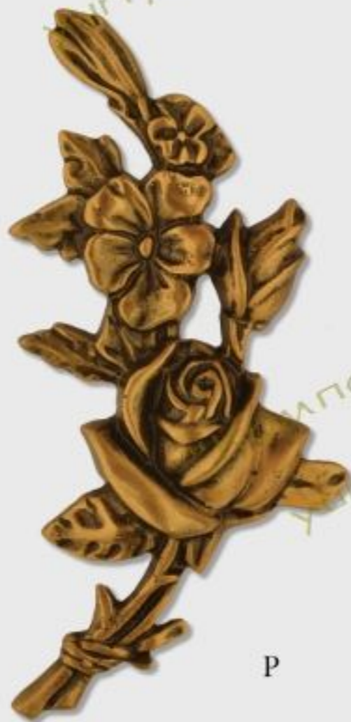
G188 h=20cm color Z/B