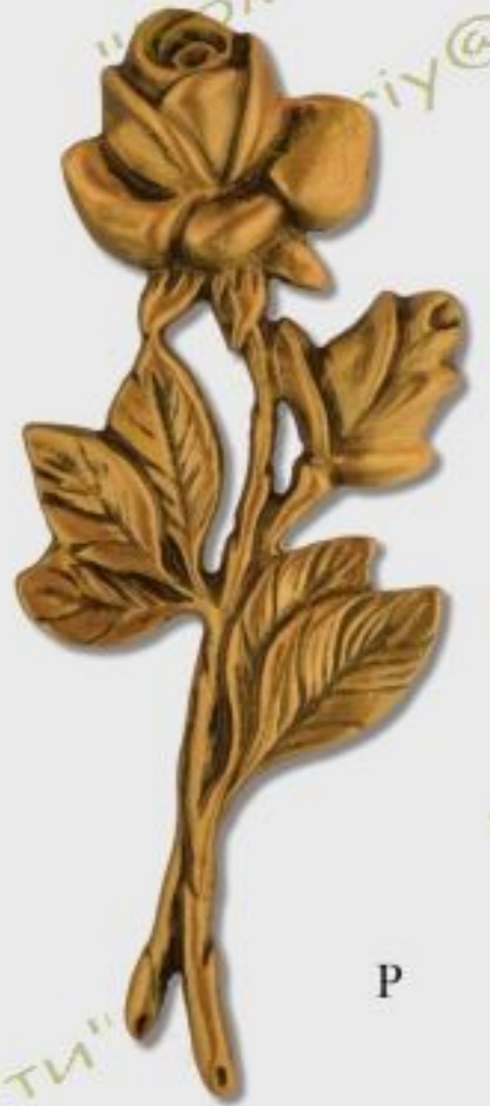
G183 h=20cm color Z/B