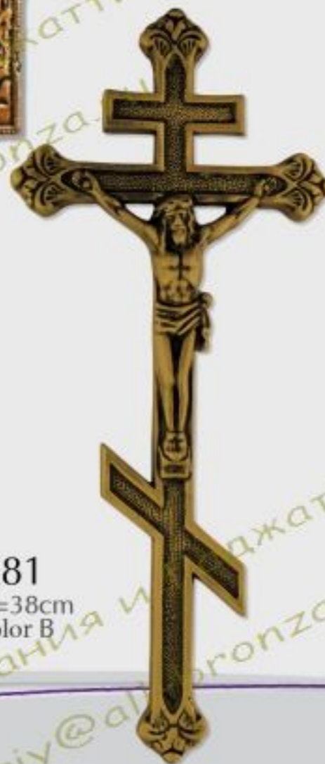
K81 h=38cm color B