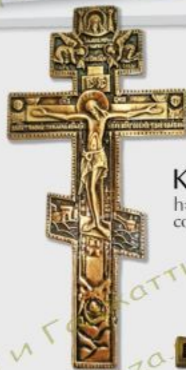
K30 h=15/26/35cm color B