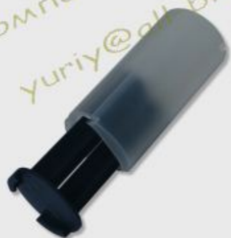
Адаптер универсальный (для двухкомпонентного клея)