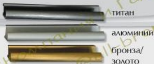
Цвета профилей R1