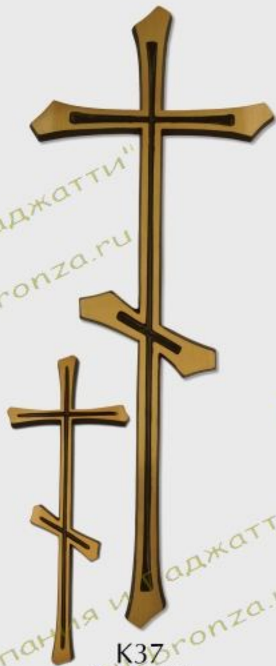
K37 h=20/25/30/45cm color Z/B