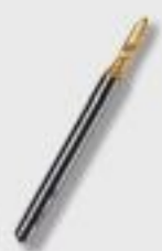
Сверло алмазное Caggiati (3/ 3,5/ 4мм)