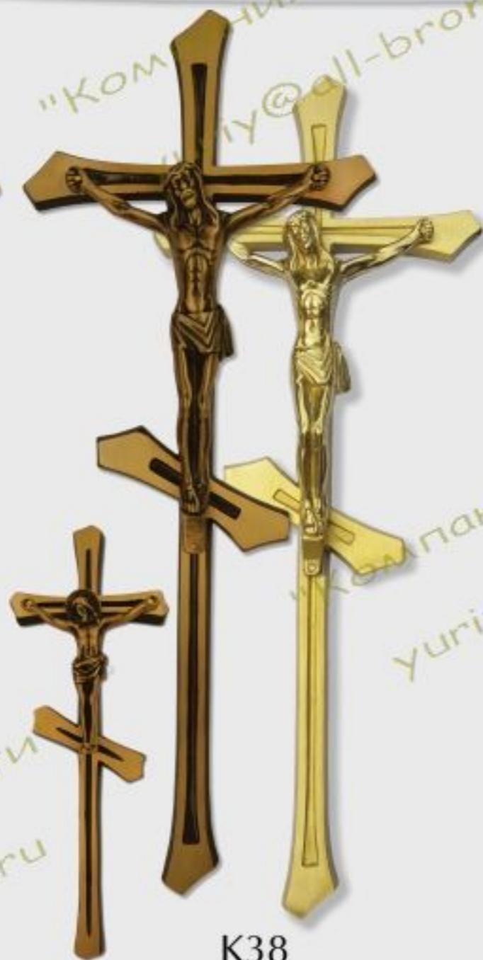
K38 h=20/25/30/45cm color Z/B