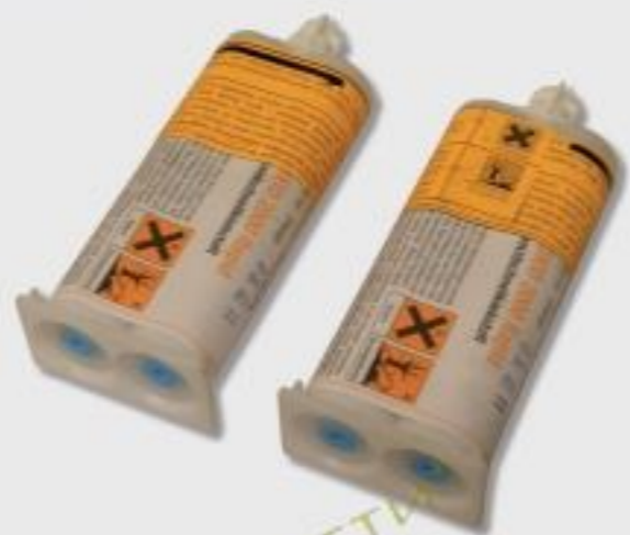
КЛЕЙ двухкомпонентный 1:1 (время высыхания 15-20 мин., прозрачный)