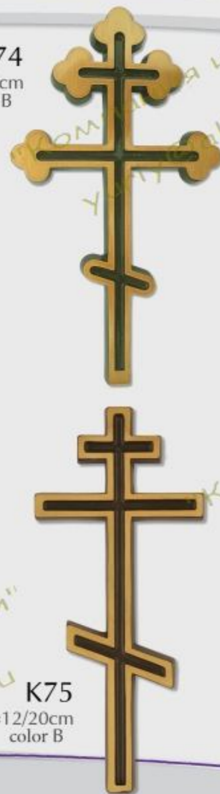
K74 h=12/20cm color B