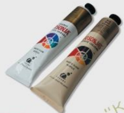
Краска-золото (светлая, темная) 75 мл