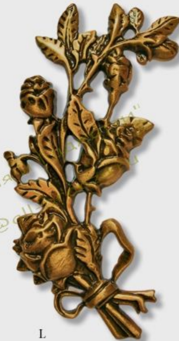
G17 h=23cm color /B